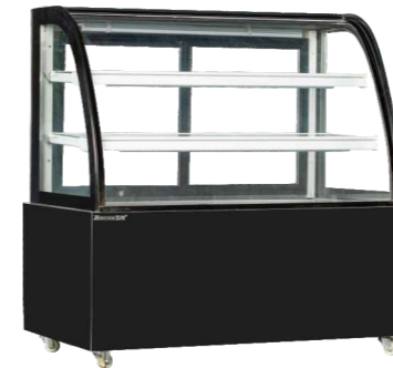
DG-900FY DG-1500FY DG-1200FY DG-1800FY