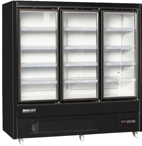
XC-ZC-13 XC-ZC-19 XC-ZC-25 冷藏系列 XC-ZD-13 XC-ZD-19 冷冻系列

Supermarket Vertical display chiller with glass door (complete machine)