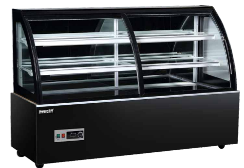
DG-1200FK DG-1500FK DG-1800FK