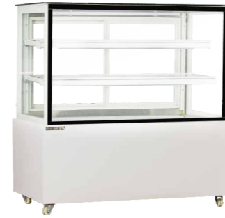
DG-900F DG-1200F DG-1500F DG-1800F