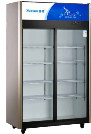
LC-1000YS LC-1200YS LC-1500YS LC-1800YS