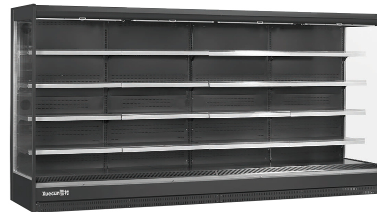
XC-CLF-19 XC-CLF-25 XC-CLF-28 XC-CLF-38