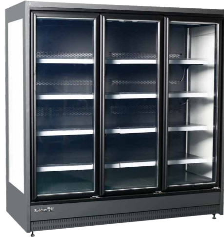
XC-CFC-19 XC-CFC-25 冷藏分体 XC-CFC-28 XC-CFC-38 冷藏分体 XC-CFD-19 XC-CFD-25 冷冻分体 XC-CFD-28 XC-CFD-38 冷冻分体

Supermarket Vertical display chiller with glass door (split type)