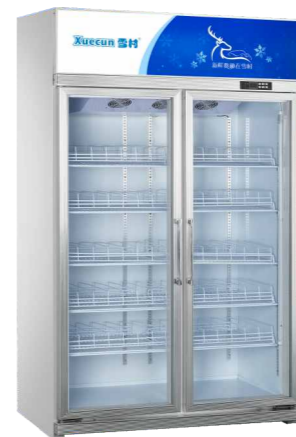
LC/LD-1260FS LC-1860FS (亮银)