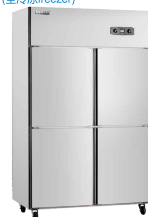
双温四门经济款 CFS-40N4X (Double temperature four-door economy)