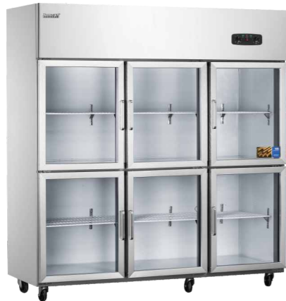
六门玻璃门 CFR-60B6 (Six-door glass door)