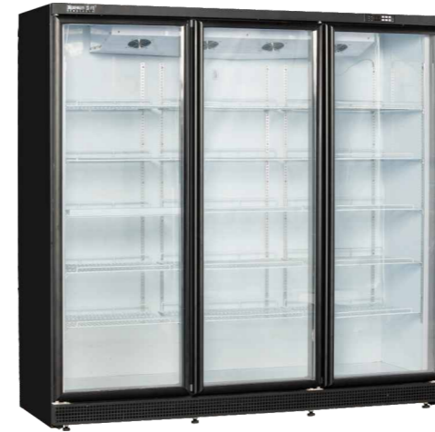
(分体) LC-F1368A LC-F2052A LC-F2736A

Air-cooled beverage cabinets in convenience stores