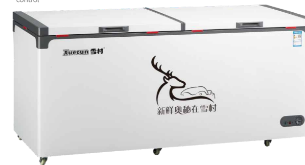
BD/BC-438 BD/BC-558 BD/BC-668 BD/BC-798