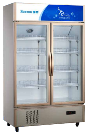
LC-1000/下 LC-1200/下 LC-1500/下 LC-1800/下