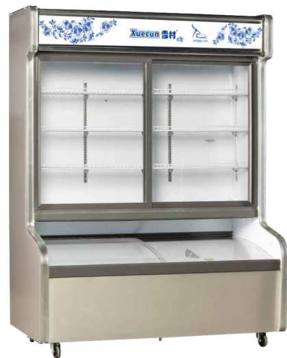
LSD-1200HSY LSD-1800HSY LSD-1400HSY LSD-2000HSY LSD-1600HSY