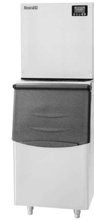
AP-350P AP-480P AP-600P AP-800P AP-1000P