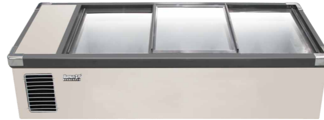
AD-1.8X/银色 AD-2.1X/银色 AD-2.4X/银色