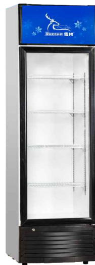
LC-228 LC-268 LC-258 LC-298