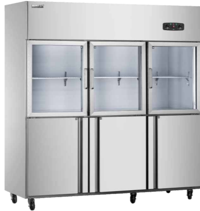
六门上玻璃下发泡 CFS-60N3B3 (Six-door kitchenrefrigerator with three glass door and three foam door)