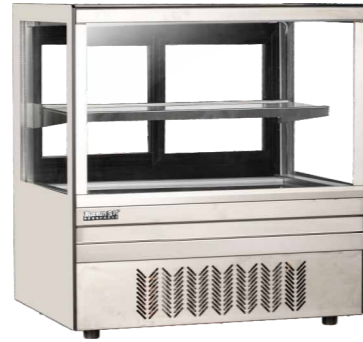
DG-TZ700 DG-TZ900 DG-TZ1200