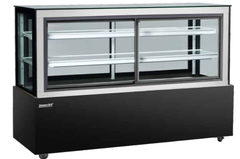
1.2米直角前开门 1.5米直角前开门 1.8米直角前开门 Rectangular cake cabinet with front door