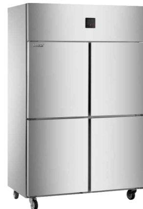
工程款-直冷/风冷款 (Direct cooling/air cooling) CFS-40N4 (直冷direct-cooling) CFD-40N4 (全冷冻freezing) CFD-40D4F (风冷air-cooling)