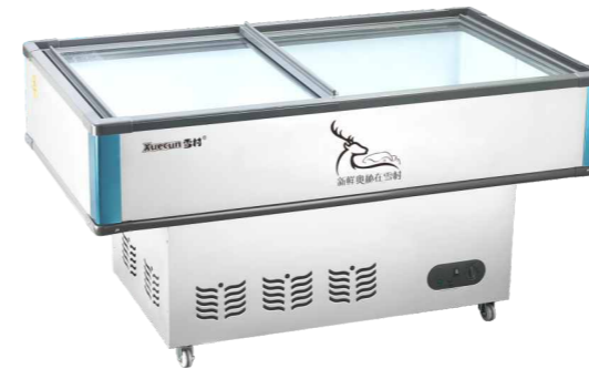
AD-1200C AD-1400C AD-1600C