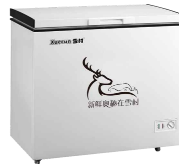
BC/BD-108 BC/BD-158 BC/BD-218