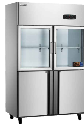
四门上玻璃下发泡 CFS-40N2B2 (Four-door kitchenrefrigerator with two glass door and two foam door)