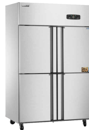
CFS-40N4(双温double temperature) CFD-40N4(全冷冻freezer)