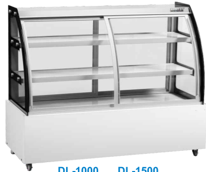
DL-1000 DL-1500 DL-1300 DL-1800

精准控温 Precise temperature control 快速制冷 Fast cooling 高效压缩机 High efficiency compressor 灵动空间 Clever space 静音运行 Mute operation 断电保护 Power-off protection