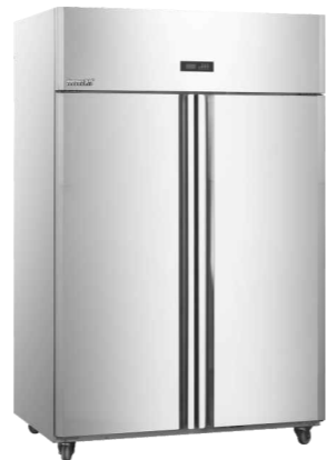
26P插盘柜 CFD-40D4F-k(201) CFD-40D4F-k(304) (Air-cooling kitchen freezer)