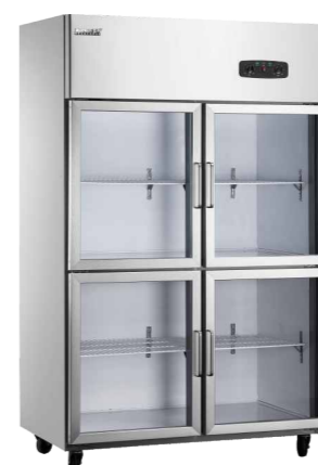
四门玻璃门 CFR-40B4 (Four-door glass door)