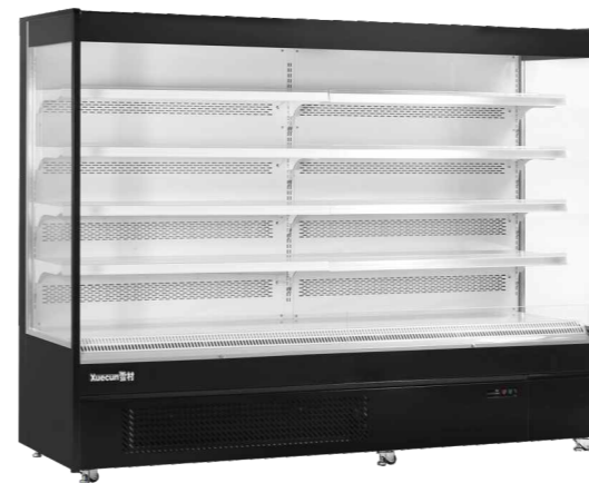
XC-ZL-10 XC-ZL-15 XC-ZL-25 XC-ZL-13 XC-ZL-19