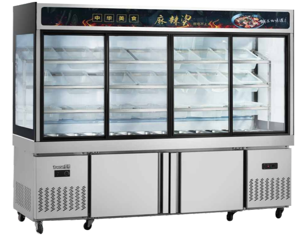
MLG-1500B MLG-2000B MLG-2500B