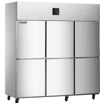
工程款-直冷/风冷款 (Direct cooling/air cooling) CFS-60N6 (直冷direct-cooling) CFD-60N6 (全冷冻freezing) CFD-60D6F (风冷air-cooling)