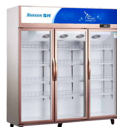
LC-1500CF LC-1500XF LC-1800CF LC-1800XF