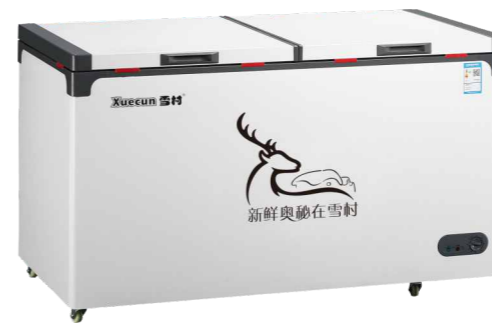
BD/BC-278 BD/BC-328 BD/BC-388