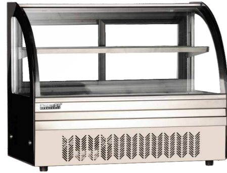
DG-TY700 DG-TY900 DG-TY1200

精准控温 Precise temperature control 快速制冷 Fast cooling 高效压缩机 High efficiency compressor 灵动空间 Clever space 静音运行 Mute operation 断电保护 Power-off protection