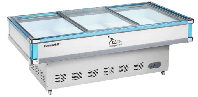
AD-1800C AD-2000C AD-2200C AD-2600C