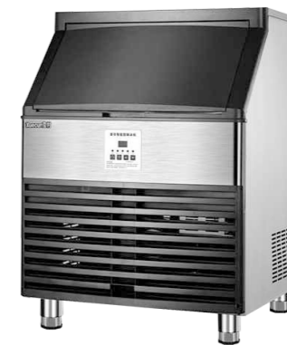
AP-150P AP-180P AP-220P