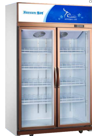
LC/LD-1260FS LC/LD-1860FS (玫瑰金)