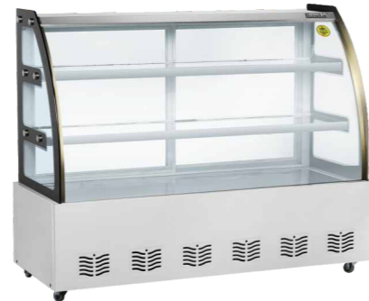
DL-1000 DL-1500 DL-1300 DL-1800