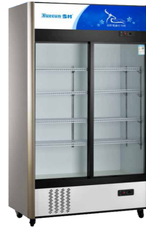
LC-1000YX LC-1200YX LC-1500YX LC-1800YX

精准控温 Precise temperature control 快速制冷 Fast cooling 高效压缩机 High efficiency compressor 灵动空间 Clever space 静音运行 Mute operation 断电保护 Power-off protection