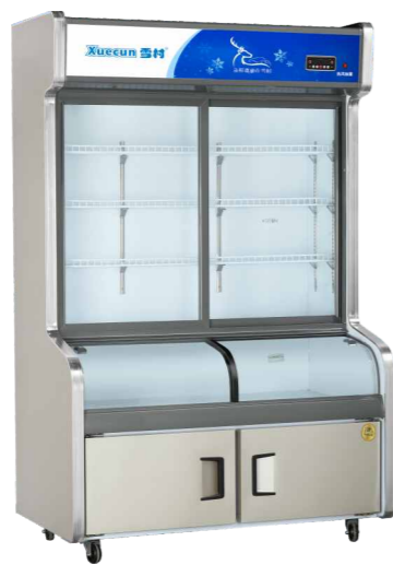
HY-1200W HY-1400W HY-1600W