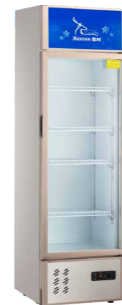
LC-238 LC-208 LC-288