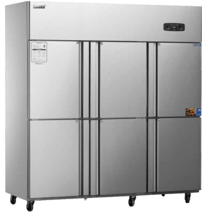
CFS-60N6 (双温double temperature) CFR-60N6 (全冷藏chiller) CFD-60N6 (全冷冻freezer)

精准控温 Precise temperature control 快速制冷 Fast cooling 高效压缩机 High efficiency compressor 灵动空间 Clever space 静音运行 Mute operation 断电保护 Power-off protection