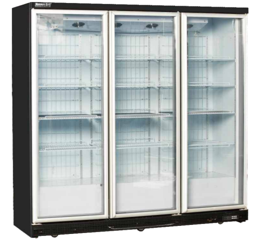
(整机) LC-N1368 LC-N2052 LC-N2736

精准控温 Precise temperature control 快速制冷 Fast cooling 高效压缩机 High efficiency compressor 灵动空间 Clever space 静音运行 Mute operation 断电保护 Power-off protection