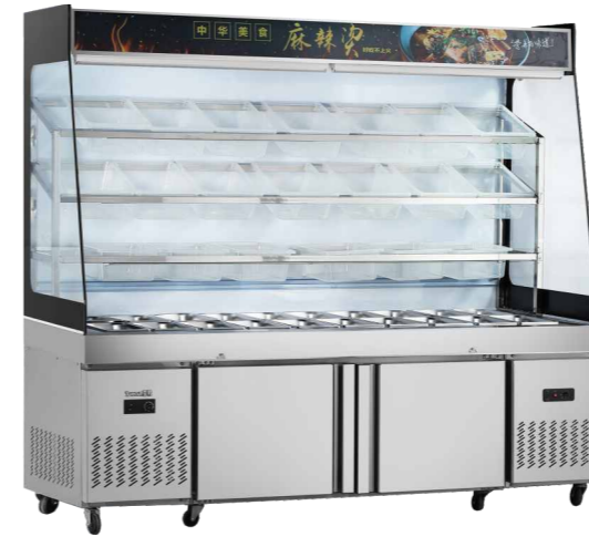
MLG-1500 MLG-2000 MLG-2500