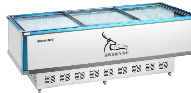
SD/SC-2600双机加深 SD/SC-2200双机加深