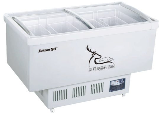
SD/SC-1500R SD/SC-1800R SD/SC-2000R