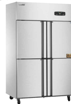
CFS-40N4(201) CFS-60N6(201) (双温double temperature) CFD-40N4(201) CFD-60N6(201) (全冷冻freezer)