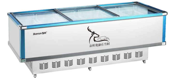
SD/SC-1800 SD/SC-2000 SD/SC-1800加深 SD/SC-2000加深 SD/SC-2000(2*1)