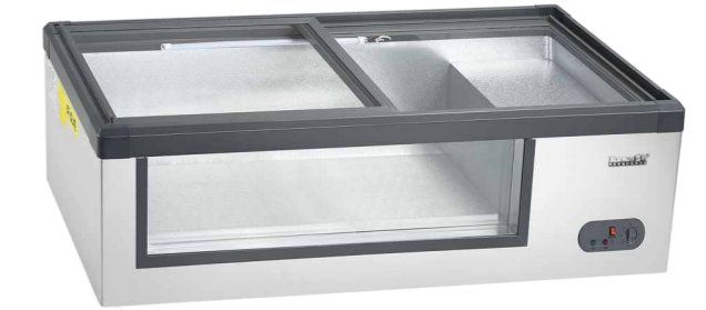
WSC-1.6Q(前透明) WSC-2.1KQ(前透明) WSC-1.8KQ(前透明) WSC-1.5KQ(前透明) WSC-2.0Q(前透明) WSC-2.4KQ(前透明)