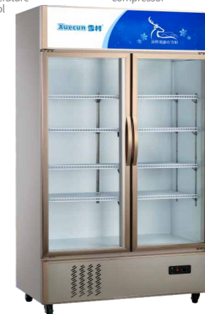
LC-1000KX LC-1200KX LC-1500KX LC-1800KX